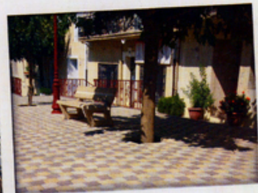
...aux patios intérieurs originaux