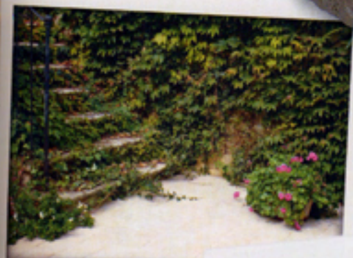
Des allées extérieures...