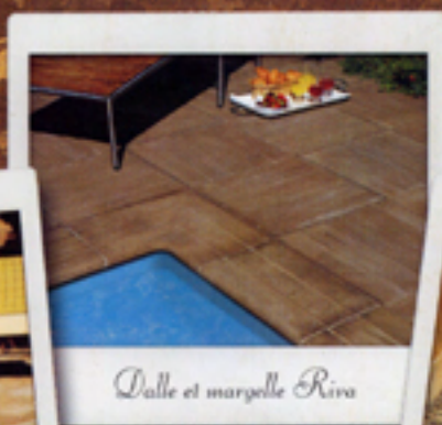
Dalle et margelle Riva