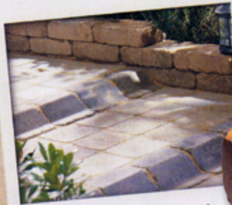
La bordurette Médiéval